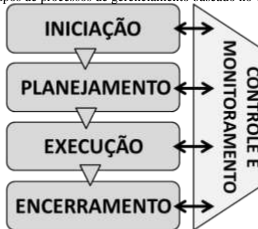
Figura 1: Cinco grupos de processos de gerenciamento baseado no Guia PMBOK

Segundo a edição do Guia consultado, o gerenciamento de projetos inclui as seguintes etapas: (a) Identificação dos requisitos; (b) Abordagem das diferentes necessidades, preocupações e expectativas das partes interessadas no planejamento e execução do projeto; (c) Estabelecimento, manutenção e execução de comunicações ativas, eficazes e colaborativas entre as partes interessadas; (d) Gerenciamento das partes interessadas visando o atendimento aos requisitos do projeto e a criação das suas entregas e; (e) Equilíbrio das restrições conflitantes do projeto que incluem, mas não se limitam, a escopo, qualidade, cronograma, orçamento, recursos, e riscos (GUIA PMBOK, 2013).