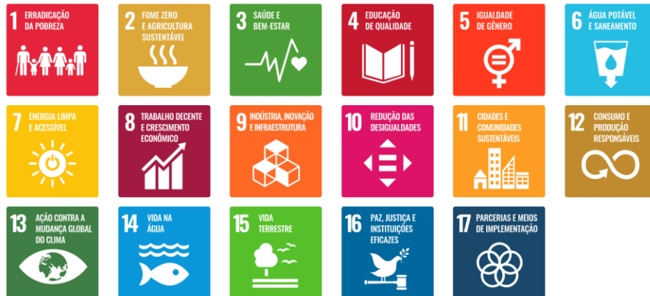
Figura 2: Objetivos de Desenvolvimento Sustentável

desigualdades, cidades e comunidades sustentáveis, consumo e produção responsáveis, ação contra a mudança global do clima, vida na água, vida terrestre, paz, justiça e instituições eficazes, e parcerias e meios de implementação (ONU, 2015).