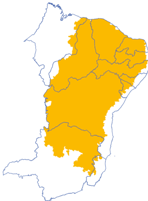
Figura 1: Semiárido brasileiro