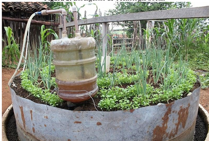
Figura 2: Biodigestor de Tecnologia Social

Entre essas soluções, destaca-se o uso do biogás, obtido pela biodigestão anaeróbica de resíduos orgânicos, como esterco animal, restos vegetais e efluentes domésticos, que pode substituir combustíveis fósseis, gerar biofertilizantes e reduzir a pressão sobre os recursos naturais (Neves, 2023; Silva, 2024). Os biodigestores de pequeno porte, Figura 2, nesse contexto, apresentam múltiplos benefícios: ampliam a autonomia energética, reduzem impactos ambientais, mitigam emissões de gases de efeito estufa e fortalecem a agricultura familiar, articulando ciência, tradição e inovação (Dagnino, 2004; Radjou; Prabhu, 2015; Quadros et al. , 2015; Abramovay, 2020).