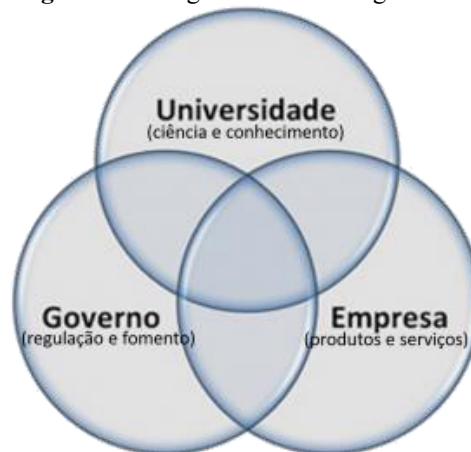
Figura 3: Biodigestor de Tecnologia Social

A difusão dos biodigestores depende da articulação de múltiplos atores, conforme o modelo da tríplice hélice, Figura 4, que enfatiza a interação entre universidades, setor produtivo e governo como motor de inovação (Etzkowitz; Leydesdorff, 2000). No semiárido nordestino, universidades e institutos federais têm papel central: a Universidade Federal do Ceará (UFC), a Universidade da Integração Internacional da Lusofonia Afro-Brasileira (UNILAB) e o Instituto Federal de Pernambuco (IFPE) conduzem projetos de pesquisa, extensão e formação técnica voltados à adaptação da tecnologia (Souza, 2020; Praciano, 2021; Neves, 2023). Em paralelo, iniciativas de cooperação internacional, como o Projeto Mais Viver Semiárido, coordenado pelo Instituto Interamericano de Cooperação para a Agricultura (IICA), demonstram a importância das redes interinstitucionais na ampliação da inovação social (Praciano, 2021).