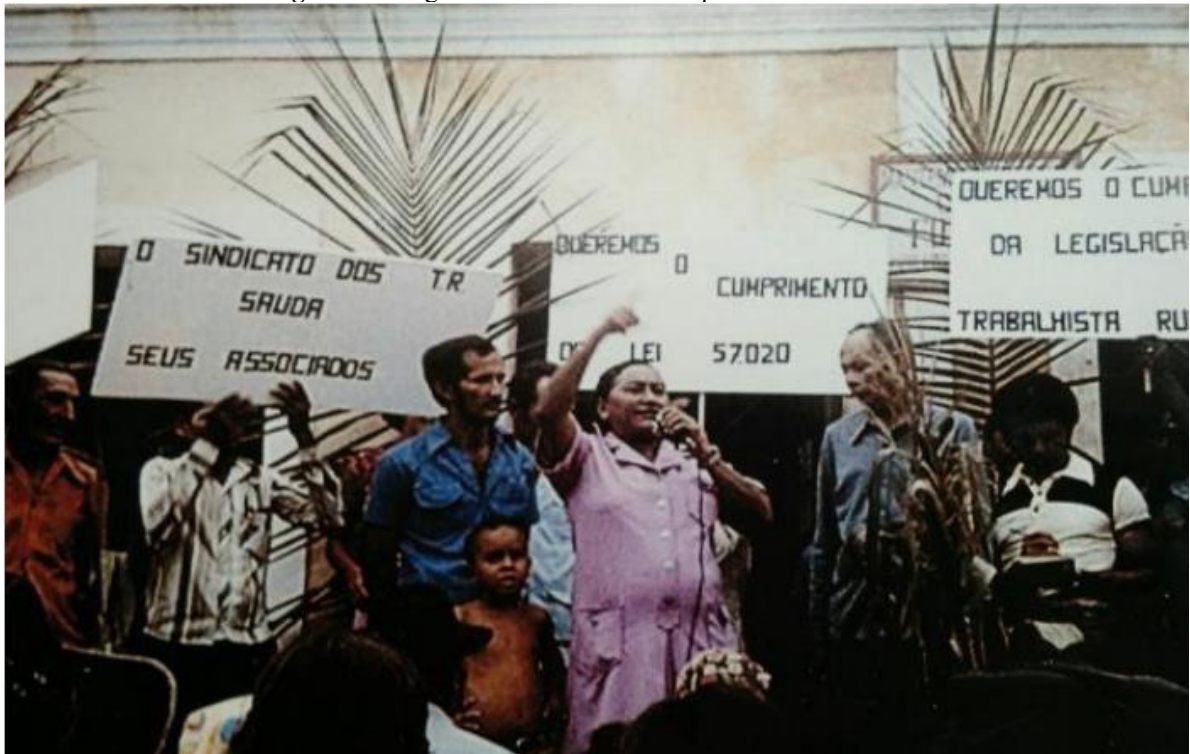
Figura 2: Margarida Alves discursando para os trabalhadores

Especialmente no Nordeste, a porta que se abriu para as mulheres foi a da Igreja, por intermédio das Comunidades Eclesiais de Base (CEB). A experiência acumulada nas pastorais serviu de laboratório para a atuação política das mulheres na luta pela terra. A partir da ocupação desse espaço elas passaram a disputar os sindicatos e outras instituições de representação de classe, a exemplo de Margarida Maria Alves, eminente líder sindical nas décadas de 1960 e 1970, assassinada em 1983. Margarida (Figura 2) tornou-se ícone da luta das mulheres camponesas e, em sua homenagem, o seu nome é utilizado como chamamento para o importante ato político denominado Marcha das Margaridas, organizado pela CONTAG (Batista, 2023).