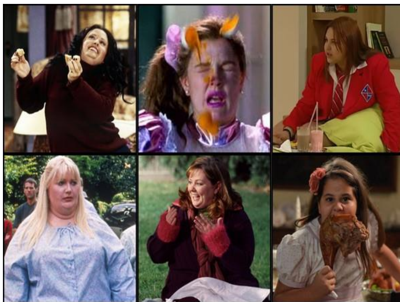
Figura 1: Algumas personagens citadas por Arruda e Miklos (2020)