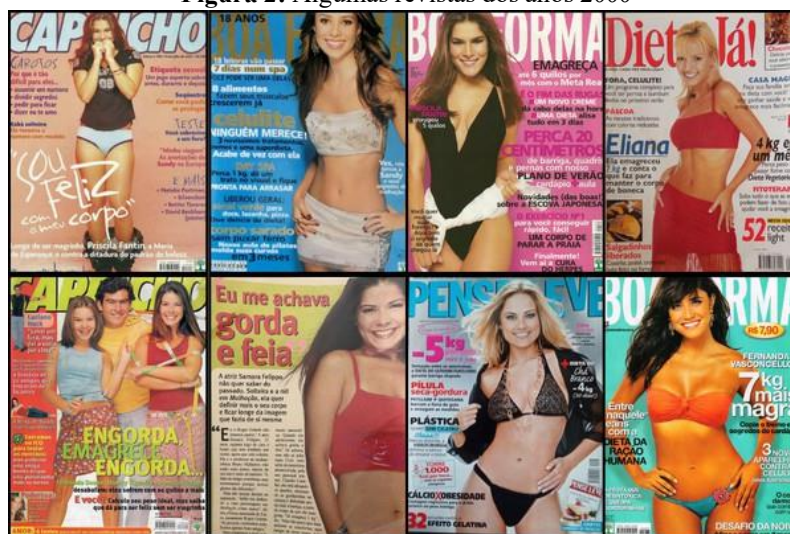
Figura 2: Algumas revistas dos anos 2000