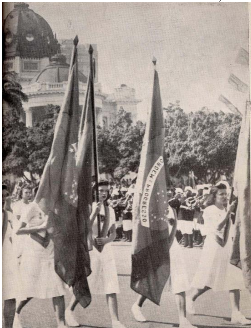
Figura 4: Desfile da Juventude Brasileira. Rio de Janeiro, 4 de setembro de 1940

O discurso era estrategicamente direcionado às personalidades ainda não formadas, com forte apelo emocional sob o mote de amor de Vargas pelas crianças, que consistia na formação de culto ao presidente “salvador da pátria”, sempre tratado com adjetivos positivos brilhante, constante, iluminado, sábio etc. (Costa; Schmitz; Remedi, 2017, p. 256-257).