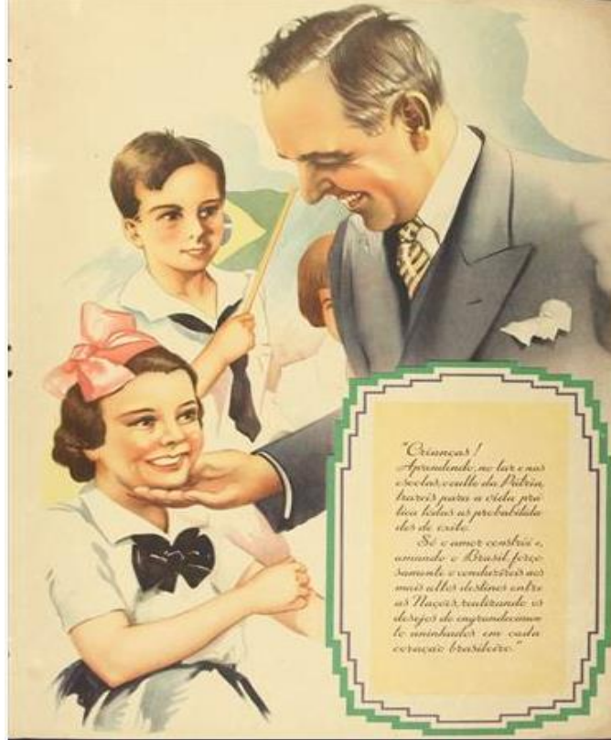
Figura 3: Caricatura de Getúlio Vargas sorridente junto a crianças

Só o amor constrói e, amando o Brasil forçosamente o conduzireis aos mais altos destinos entre as Nações, realizando os desejos de engrandecimento aninhados em cada coração brasileiro (Getúlio, 1940).