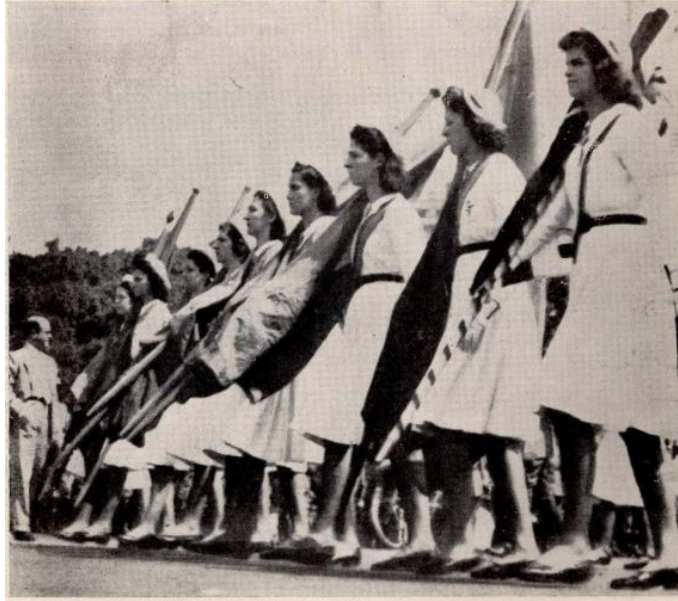
Figura 5: Desfile da Juventude Brasileira. Rio de Janeiro, 4 de setembro de 1940