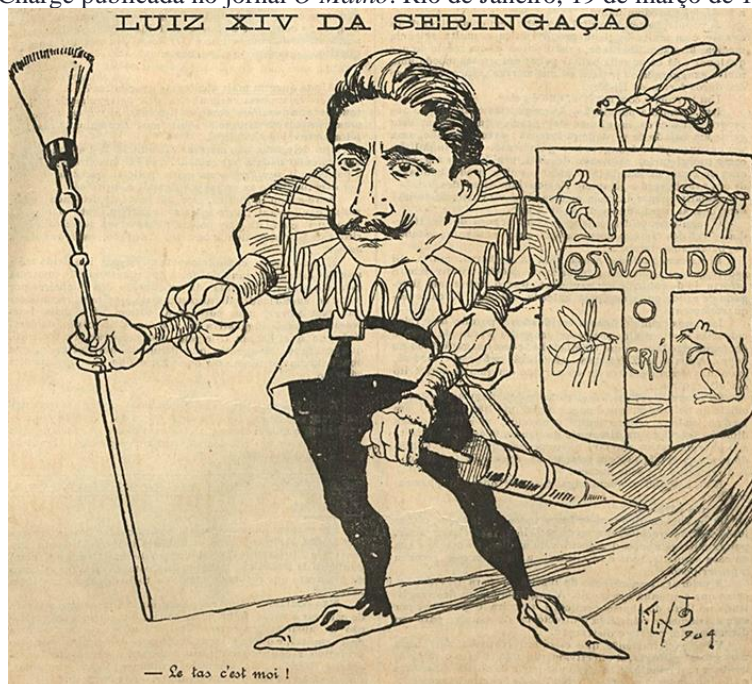
Figura 1: Charge publicada no jornal O Malho . Rio de Janeiro, 19 de março de 1904