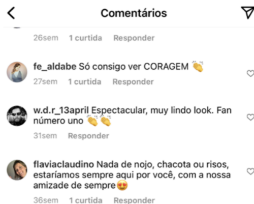
Figura 5: Print das interações realizadas no Instagram referentes ao Dia do Orgulho LGBTQIA+

Quer participar deste "jogo"? Então responde aí.