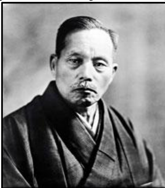
Figura 1 - Tsunesaburo Makiguchi, novembro de 1940