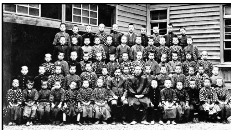
Figura 3 - Makiguchi com os alunos da Escola Primária Shirokane, 1922 (primeira fila, centro)