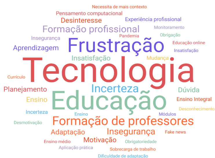
Figura 2: Infograma - nuvem das palavras utilizadas pelos professores.

Elaborado pelas autoras a partir das transcrições das entrevistas.